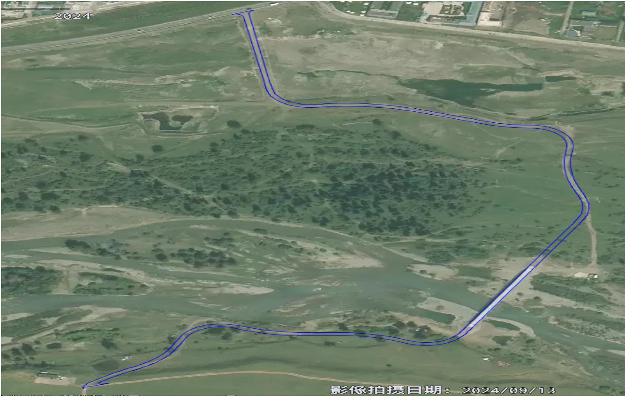
新建依提跟赛 6 米宽内部连接道路 1.2 公里（那拉提镇拜依盖托别村草场，位于景区河谷草原依提跟赛节点）