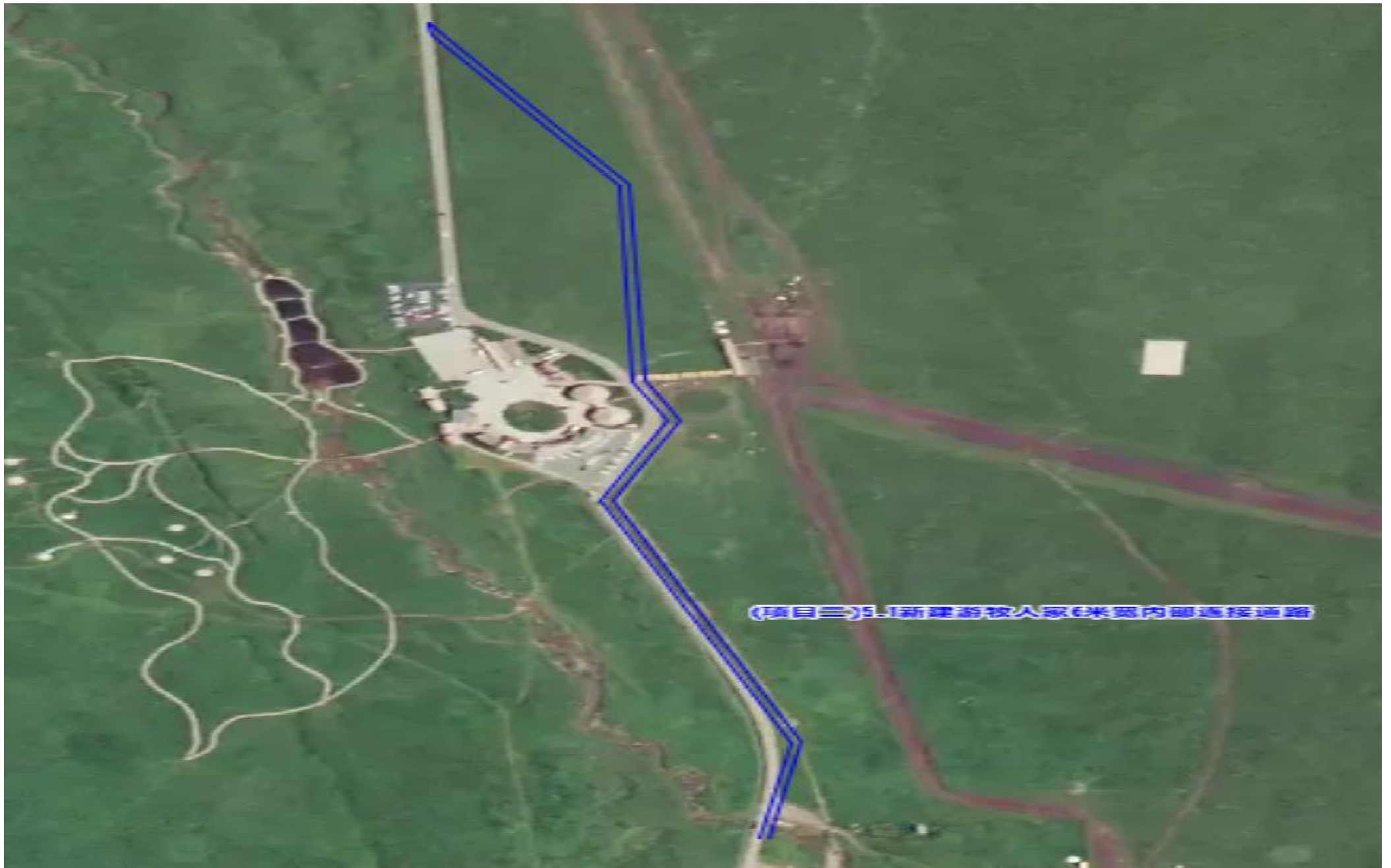
新建游牧人家 6 米宽内部连接道路 1 公里（玉丰镇别斯托别村草场，位于景区空中草原游牧人家节点）