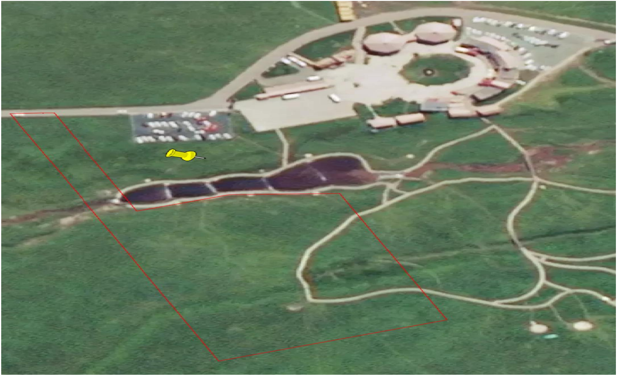
新建游牧人家节点综合性游客服务中心 3000 m 2 +固定式厕所 600 m 2 +停车场 6000 m 2 +连接道路 200 米(玉丰镇别斯托别村, 恰普河加嘎村草场, 位于景区空中草原游牧人家节点)